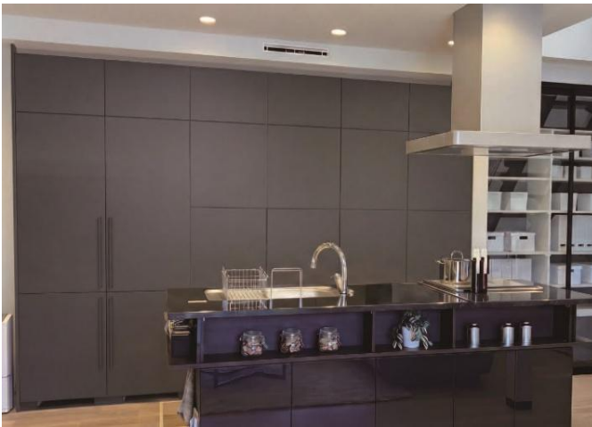
■「Kitchen Wall Cabi NEO」設置イメージ