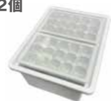
<冷凍室最上段に収納>