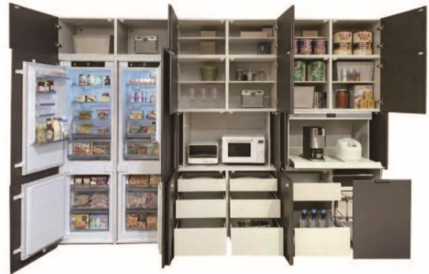
■ビルトイン冷蔵庫と大容量収納イメージ

本製品は、ヤマダホールディングスグループと、冷蔵庫ブランド別世界販売台数シェア1位 ※ であるハイアール、住宅資材製造・販売を手がける総合住宅資材メーカーの永大産業がタッグを組み、美しさと機能性を徹底的に追求し共同開発した、革新的なビルトイン冷蔵庫付キッチン収納キャビネットです。