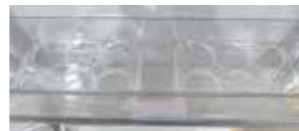
<ドアラックに収納>