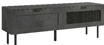
幅 135cm タイプ

テレビの幅にちょうどいい3サイズをご用意しました。奥行もテレビの脚サイズに合わせて最適化し、幅135cm・160cmは奥行37cm、幅200cmは奥行45cmに設定。必要十分でコンパクトなサイズを実現しました。