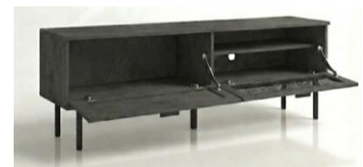
幅 135cm 幅タイプ

下方向に開くフラップ扉を採用しているため、最小限のスペースで開閉でき、また開いた扉が邪魔になることもなく大型収納を快適に使えます。