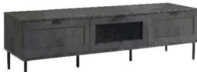
幅 160cm タイプ