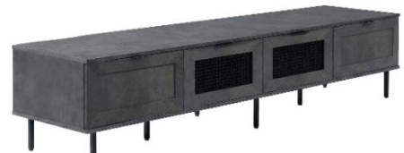
幅 200cm タイプ