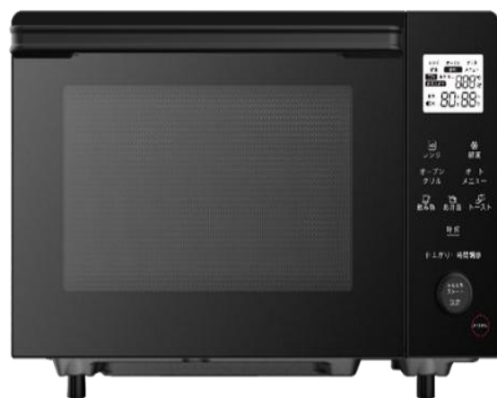
20L オープンレンジ YMW20VP

こうした背景を踏まえ、毎日の調理に便利な、時短あたたため・センサー自動あたたため機能を搭載し、3年保証で安心してお使いいただける 18L 電子レンジ・20L オープンレンジを開発しました。