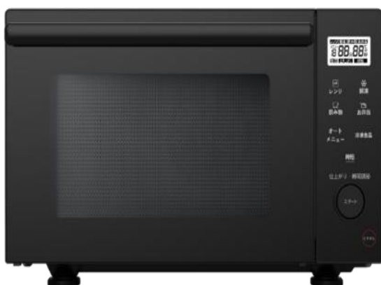
18L 電子レンジ YMW18FP