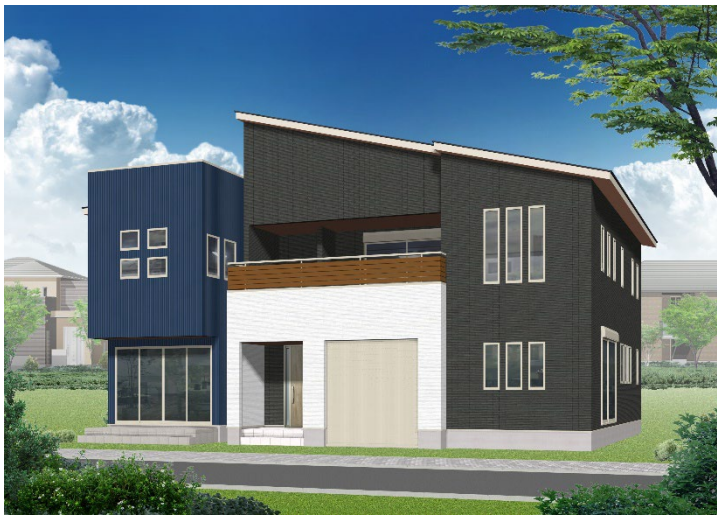
桧家住宅 札幌森林公園展示場 外観（イメージ）