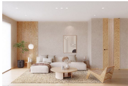
「ジャパニーズモダン」コーディネート例