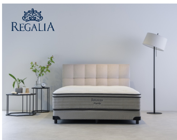
※「ロイヤルティ」イメージ

株式会社ヤマダデンキ 大塚家具事業部（以下大塚家具）は、100年以上にわたり、理想の眠りを追求する米国の老舗高級マットレスメーカー「キングスダウン」社と共同開発した、プレミアムマットレスブランド『REGALIA（レガリア）』から、スタンダードラインの「HONESTY（オネステイ）」と「LOYALTY（ロイヤルティ）」をリニューアルし、IDC OTSUKA全店舗にて販売を開始いたしました。