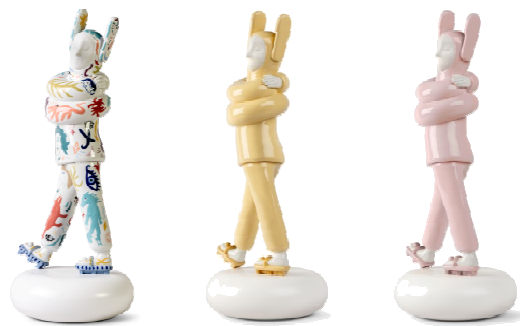
Embraced【限定版】 / Embraced【通常版】 (ソフトイエロー・ソフトピンク)

イタリアを代表するラグジュアリーファニチャーブランド「Poltrona Frau（ポルトローナ・フラウ）」は、スペインのラグジュアリーポーセリンアートブランド「LLADRÓ（リヤドロ）」とコラボレーションし、『Poltrona Frau Tokyo Aoyama meets LLADRÓ』を2022年10月21日（金）から11月3日（木・祝）までポルトローナ・フラウ東京青山にて開催いたします。