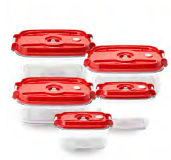
追加用真空保存容器