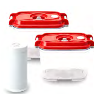
真空保存容器セット