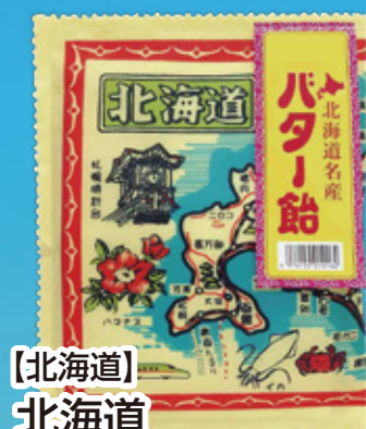
【北海道】 北海道 地図布バター飴