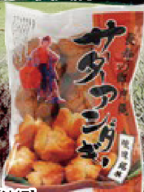
【沖縄】 サターアングギー