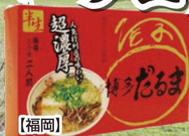
【福岡】 博多ラーメンだるま