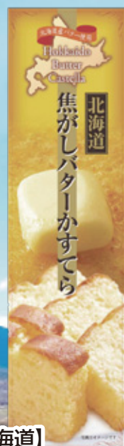
【北海道】 北海道 焦がしバター かすてら