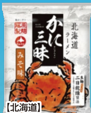
【北海道】 北海道ラーメン かに三味みそ