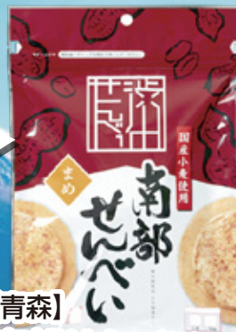
【青森】 南部せんべい