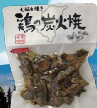
【宮崎】 鶏の炭火焼き