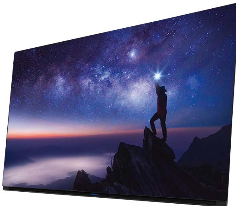
FUNAI 有機 EL テレビ FE-65U7020