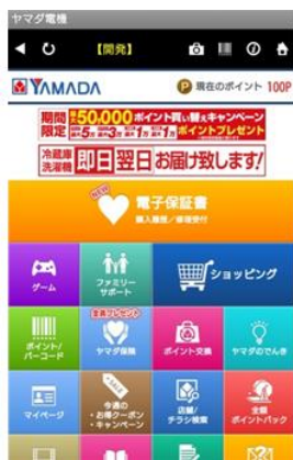
「ヤマダ電機 ケイタイ de 安心」アプリ内のマイページをタップ