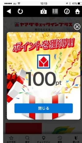
チェックインしてポイントを獲得