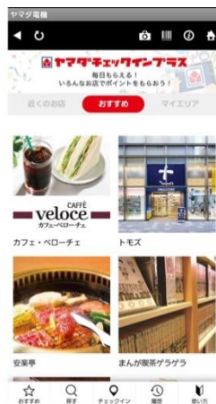
「ヤマダチェックインプラス」TOP 画面イメージ