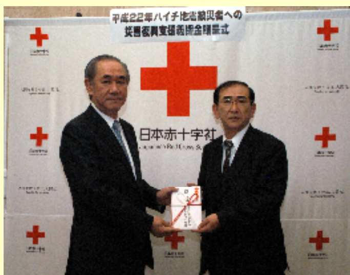
一宮社長より日本赤十字社大塚副社長へ目録を手渡す