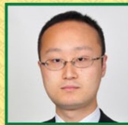
わたなべ あきら 渡辺 明 棋王・王将