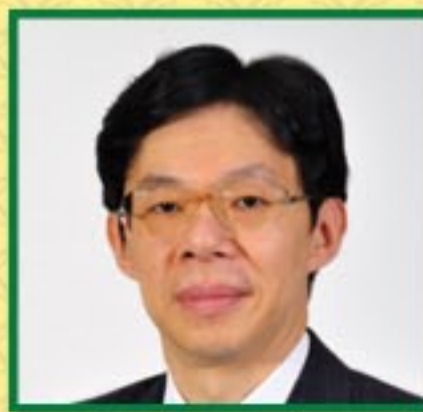
たにがわ こうじ 谷川 浩司 九段 (日本将棋連盟会長)