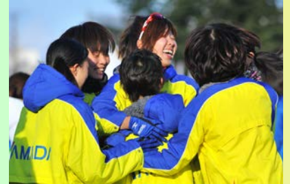
3位入賞の歓喜にわく、大応援団(写真左)と選手(写真右)