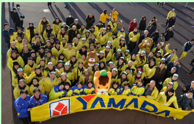
総勢200名の大応援団と一緒に全員駅伝で3位入賞の快挙!!