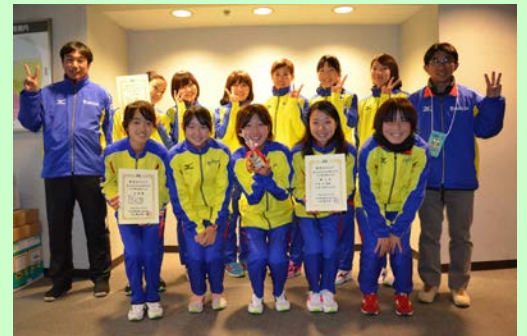
応援ありがとうございました。