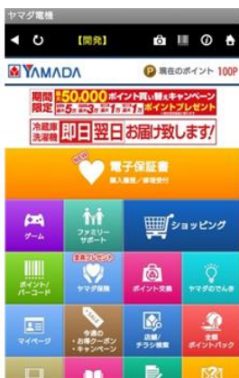
「ヤマダ電機 ケイタイ de 安心」アプリ内のマイページをタップ