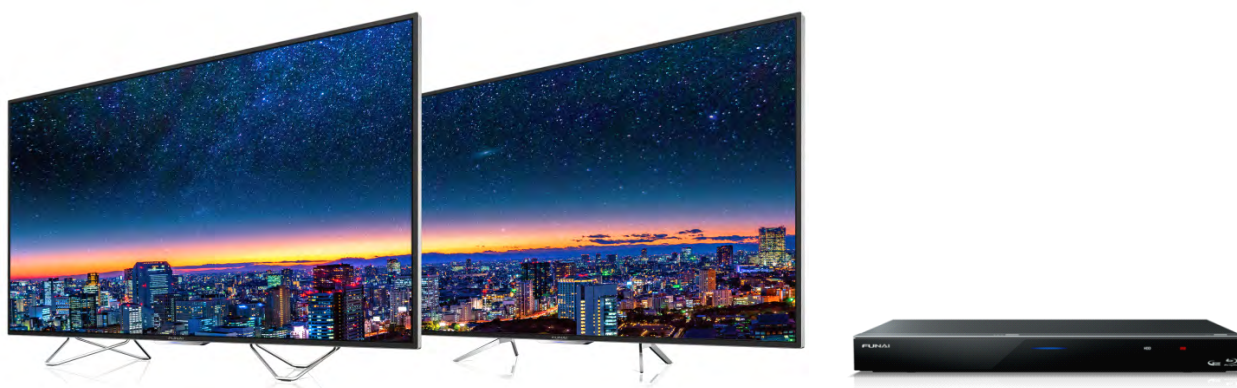
FUNAI 4K 対応テレビ FL-65UA6000 (左) / FL-65UD4100(中) / FUNAI ブルーレイディスクレコーダー FBR-HX3000 (右)

船井電機は、2017 年 6 月にヤマダ電機グループで独占販売を開始した FUNAI 4K 対応テレビの 6000 シリーズおよび 4100 シリーズに、それぞれ 65V 型を追加、また FUNAI ブルーレイディスクレコーダーに 2 機種を追加し、11 月 3 日より発売致します。